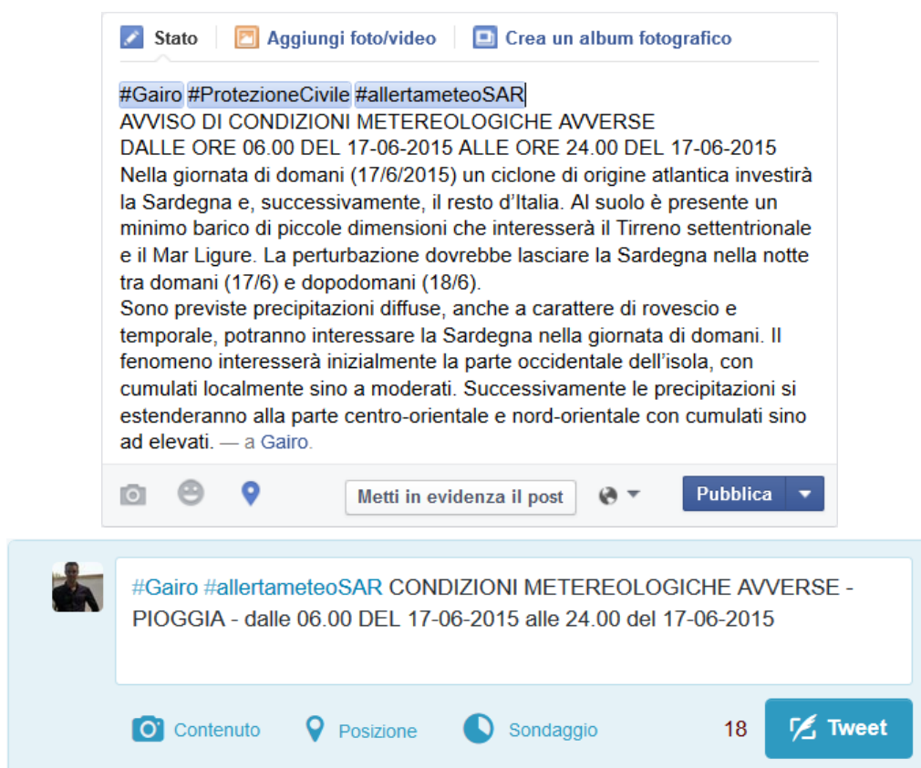
Fig.1 – Esempi di pubblicazione avvisi meteo su social network

Esempio di pubblicazione su sociale (Twitter e Facebook). Esempio: